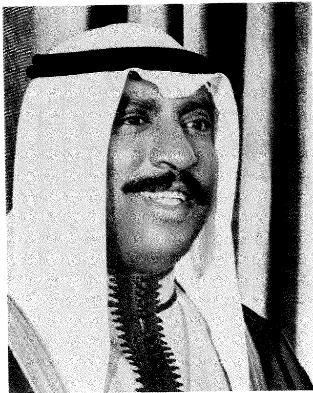
Son Altesse CHEIKH SAAD AL-ABDULLA AL-SALEM AL-SABAH Prince Héritier & Premier Ministre